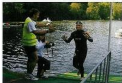
Schwimmen im Neoprenanzug: 11,4 Kilometer sind zu bewältigen

Wie schafft man es, Fulltime-Job, eine sechsköpfige Familie und Hochleistungssport unter einen Hut zu bringen? Und auch noch die Energie für die Zusatzfunktion eines Gesundheitsmoderators aufzubringen? Egger: „Der Beruf macht Freude, die Arbeit im Competence Center, Zentrale Auskunftsstelle Zoll und Taric-Verwaltung ist sehr